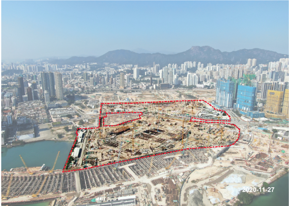
圖 2：啟德體育園和相鄰地盤