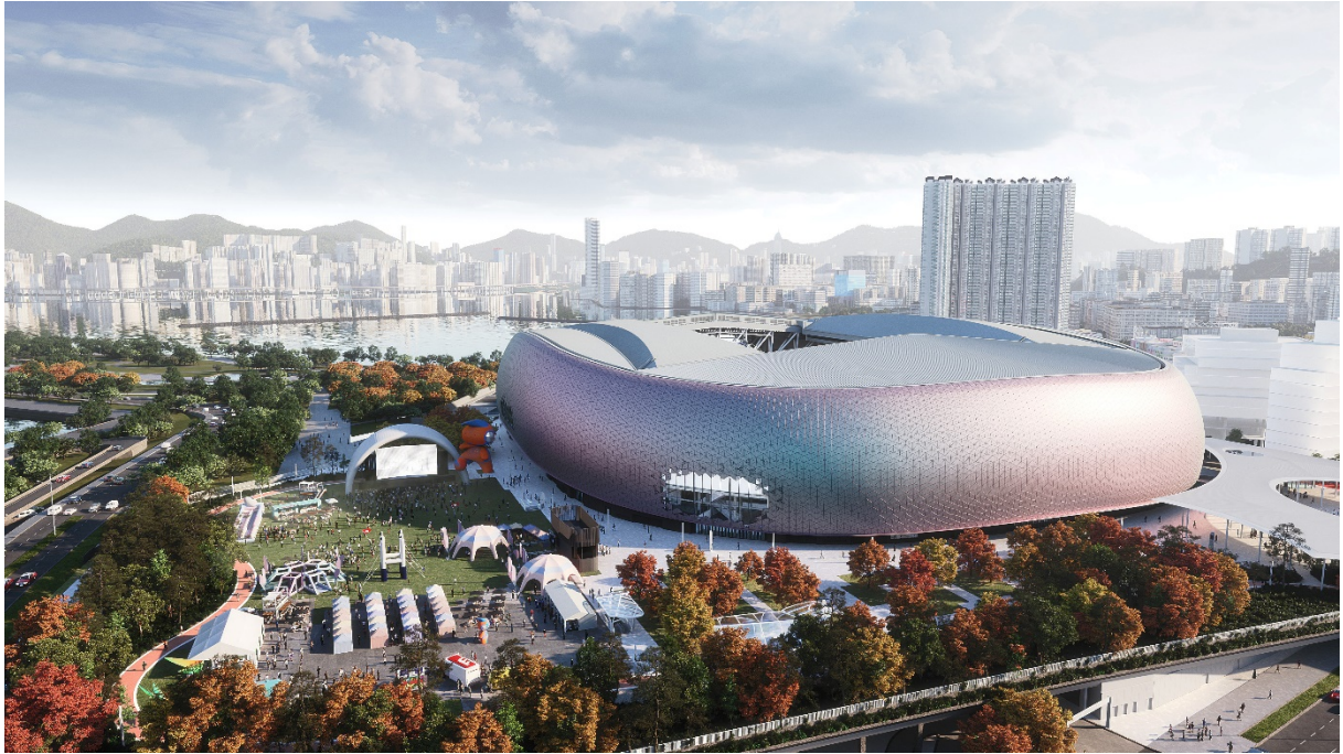
圖 10：具臨時設備的多用途活動區