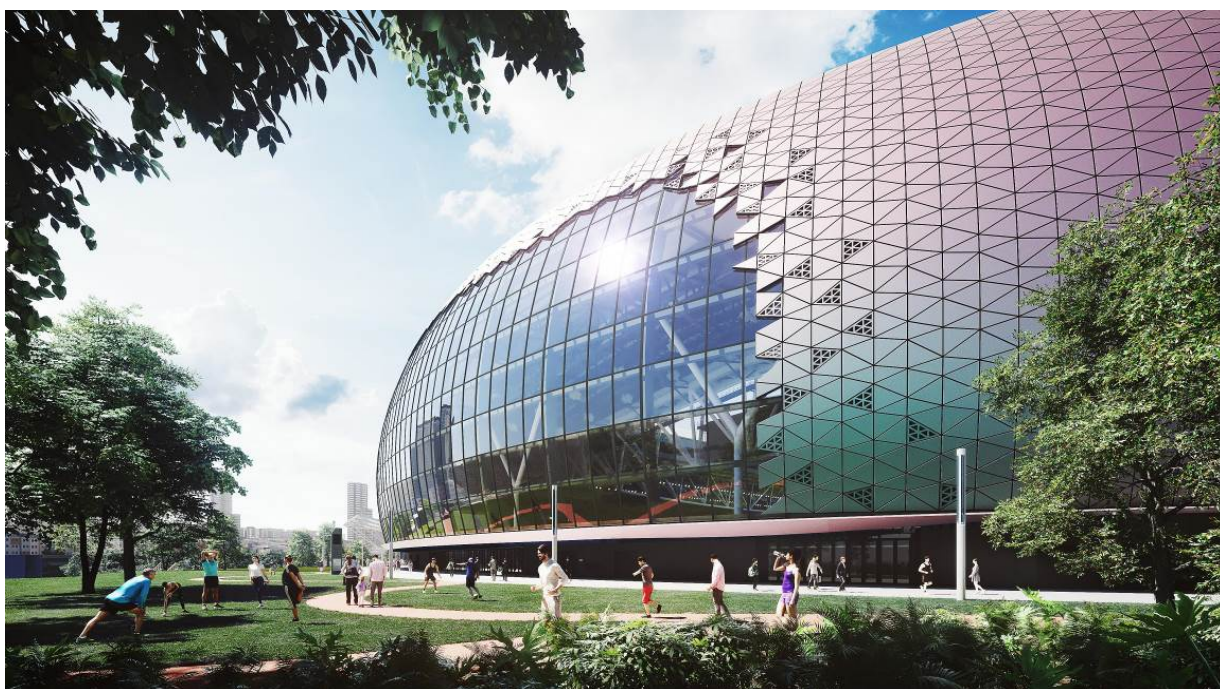
圖 8：主場館南看台的大型玻璃幕牆