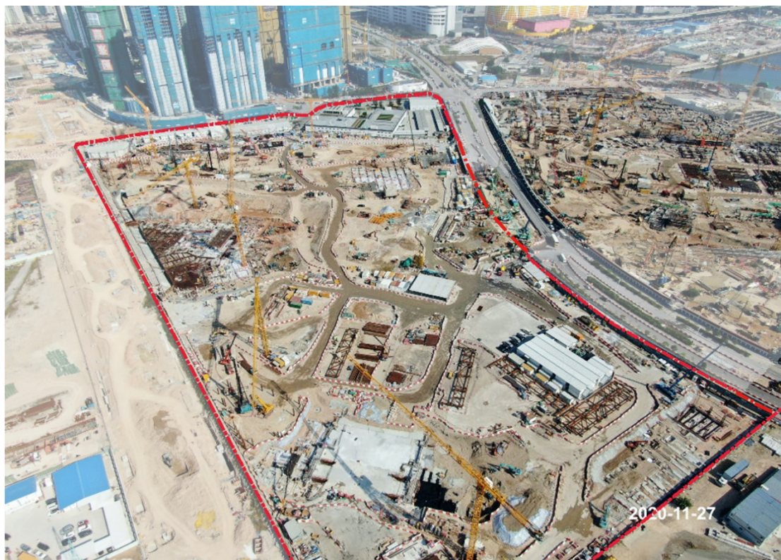
圖 5：興建中的室內體育館(上方)和公眾運動場(下方)