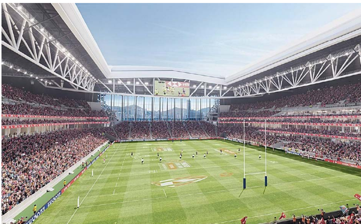
圖 7：具備可開合頂蓋的主場館和南看台