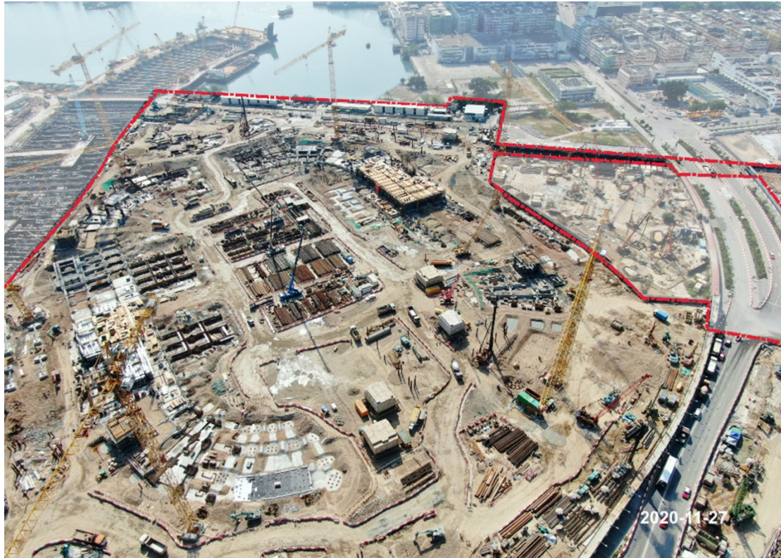
圖 4：興建中的主場館