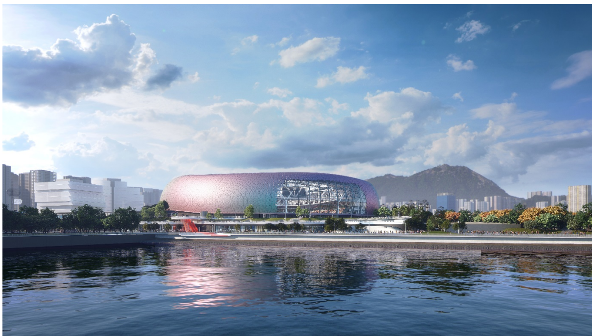
圖 6：主場館前臨海濱