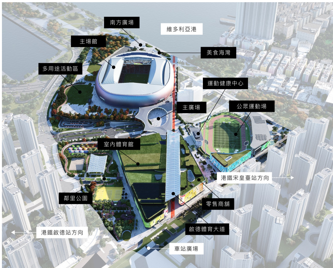
圖 1：啟德體育園鳥瞰圖